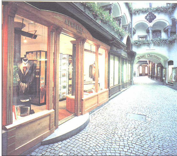
Mittelpunkt der Herrenmode in Salzburg.